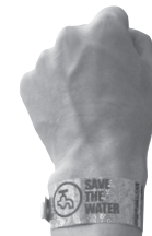
華やかさ抜群!パーティーに。