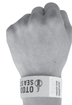
低コスト!破れにくい!