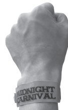
耐水性抜群!付け心地○