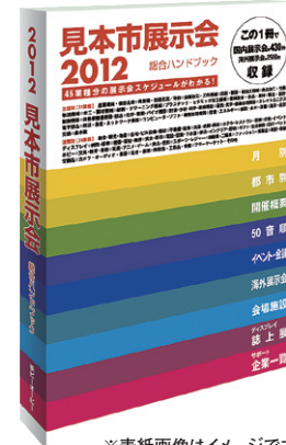
※表紙画像はイメージです。

国内主要展示会の年間スケジュール・概要を紹介 2012見本市展示会総合ハンドブック